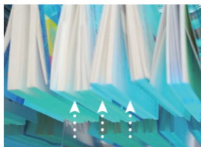
4 紫外線ランプで除菌開始。 同時に下から送風されます