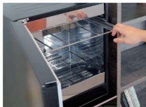
1 除菌ボックスのドアを開け ブックハンガーを引き出します