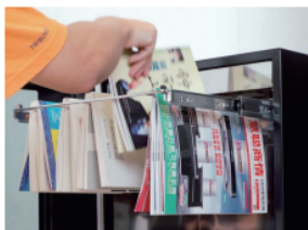
6 ドアを開け、除菌された本を 取り出して下さい