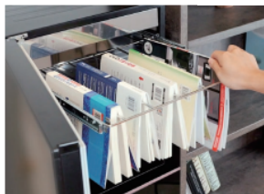
2 本の中央辺りのページを開き ハンガーに掛けます