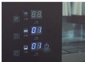
5 60秒後除菌完了。 時間表示とランプが消えます